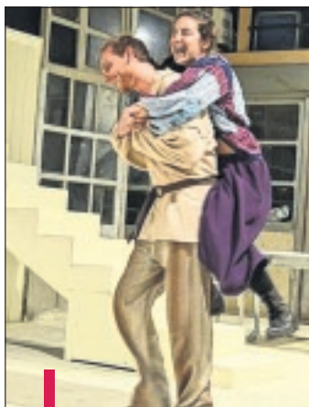
Amour et trahison