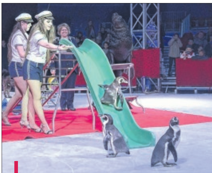
Sur la piste, les pingouins font du toboggan et les chats des pirouettes.