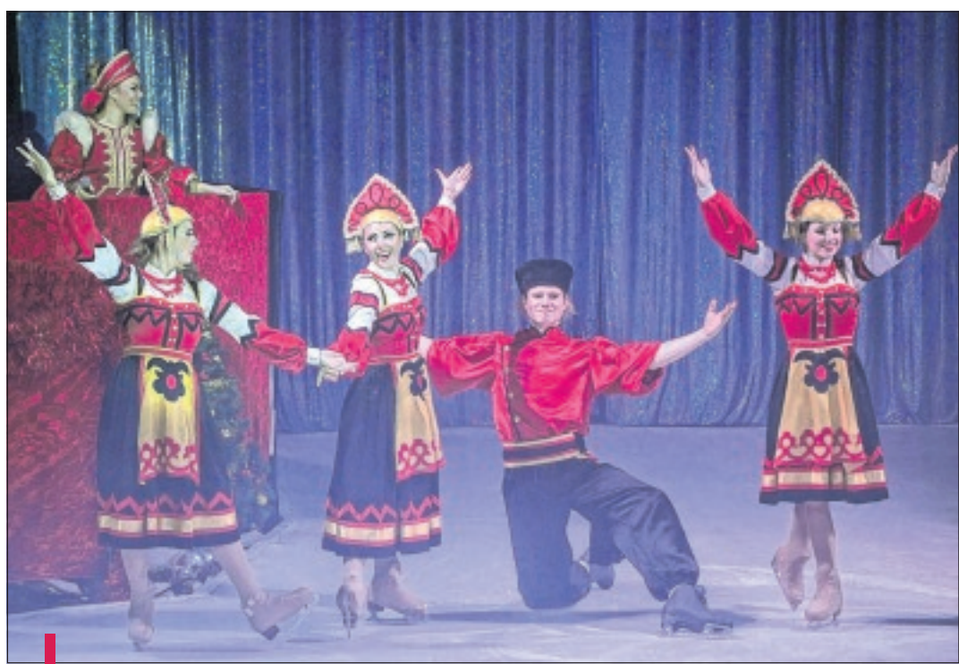
Un cirque dans la plus pure lignée de la tradition russe.

Même à Marseille, sous son chapiteau de Pont de Vivaux, quand le Grand cirque de Saint-Pétersbourg commence, c'est par un festival de tenues folkloriques et un accueil avec une langue âpre et suave qui roule comme les robes colorées virevoltent sur la piste glacée. Les patineurs font des pirouettes et, parmi les premiers numéros de ce show ultra-traditionnel, on peut apercevoir une rei-